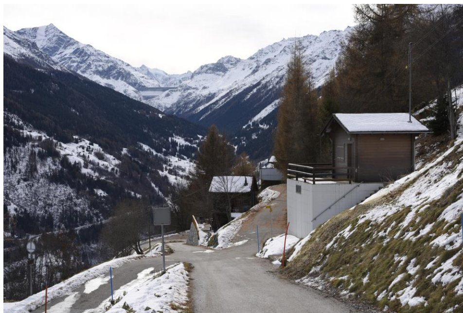
Chambre de mise en charge

L'énergie mise à disposition des communes actionnaires a été de 23'775 MWh.