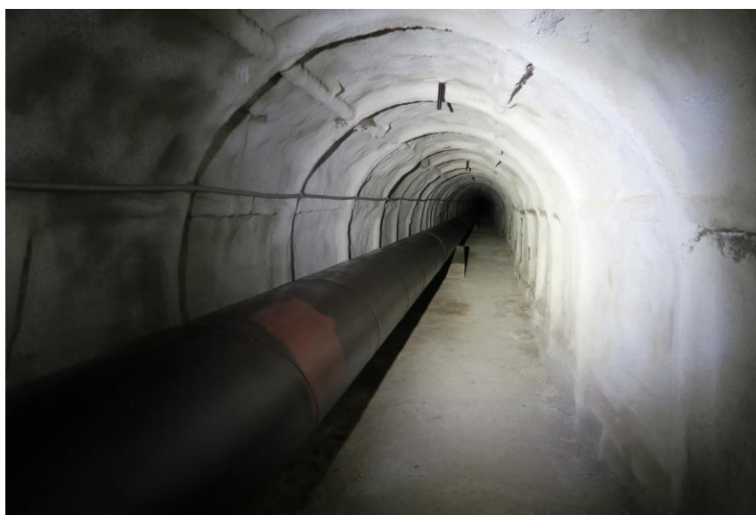
Tronçon en galerie de la conduite forcée

En ce qui concerne la fiscalité, la procédure relative au recours de Leteygeon SA contre le modèle contesté d'imposition des sociétés hydroélectriques valaisannes suit son cours.