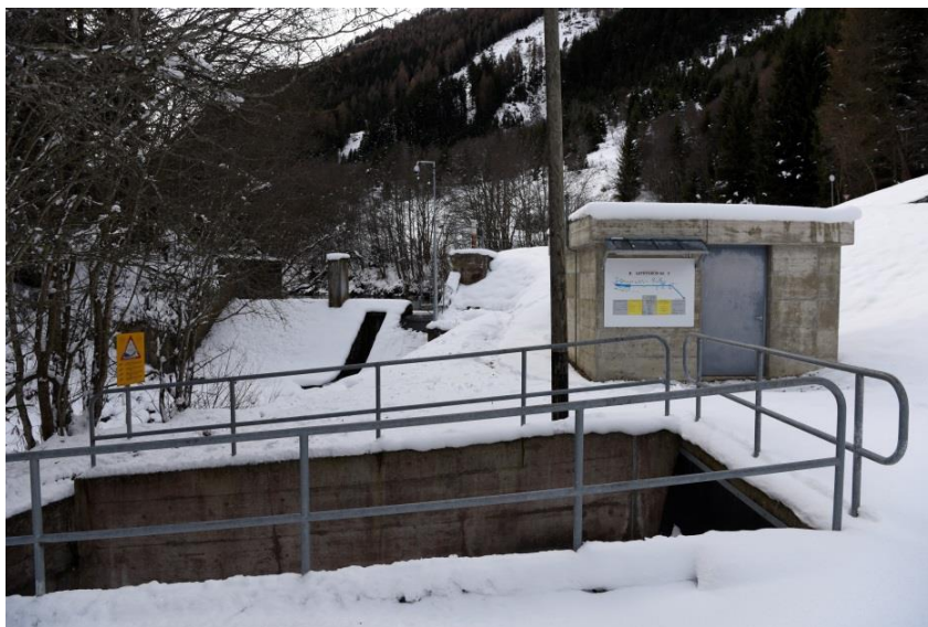
Installation de la prise d'eau de Praperoz

En ce qui concerne la fiscalité, la procédure relative au recours de Leteygeon SA contre le modèle contesté d'imposition des sociétés hydroélectriques valaisannes suit son cours.